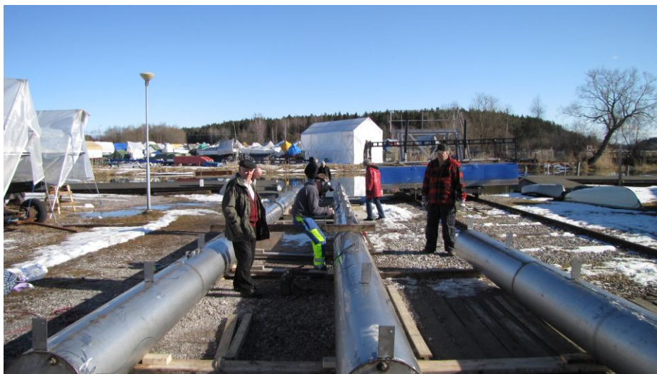
Bilden visar när vi bygger rörbrygga till Tallskär

* Inköp av några nya möbler till Klubbhuset på Tallskär